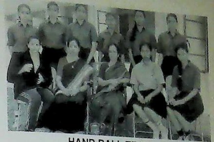
HAND BALL TEAM