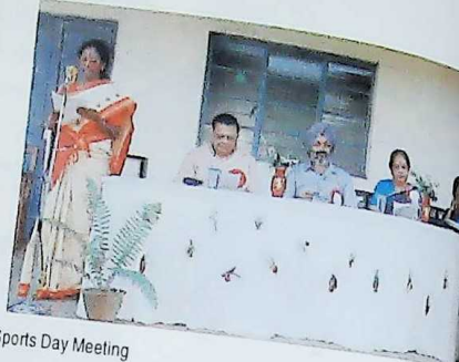
Sports Day Meeting