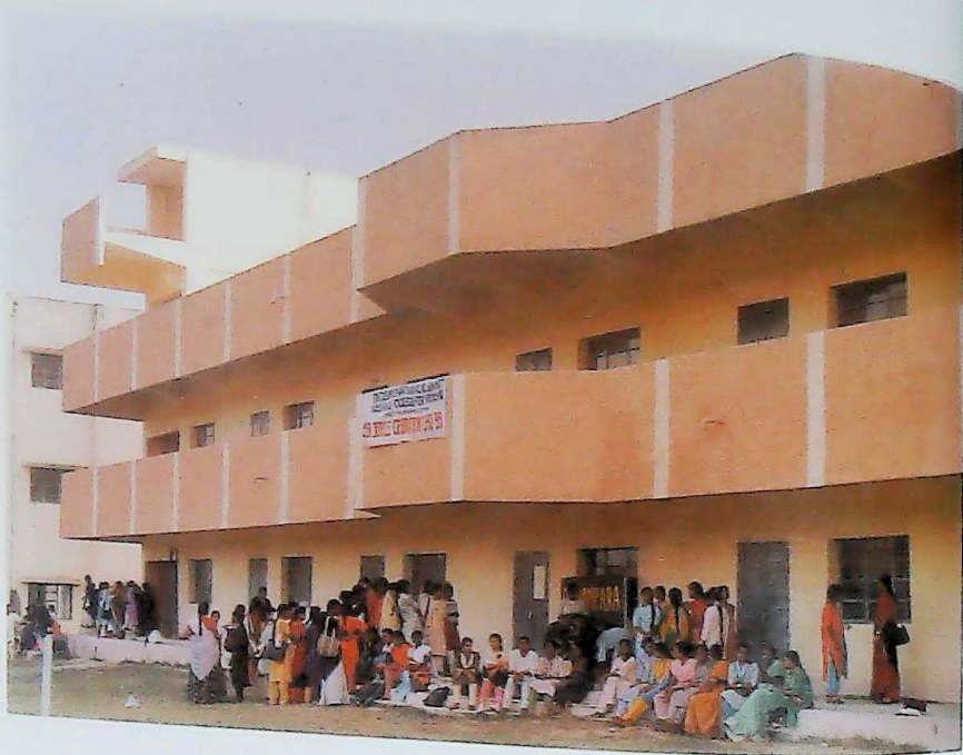
College New Block.