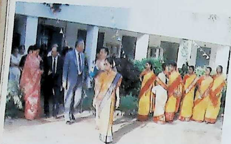
College Day Chief Guest and the Managing Committee