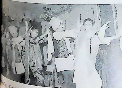
College Day - Entertainment