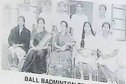
BALL BADMINTON TEAM