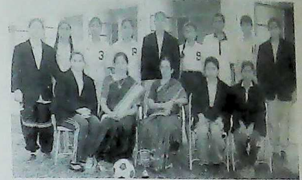
FOOT BALL TEAM