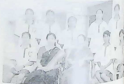
BASKET BALL TEAM