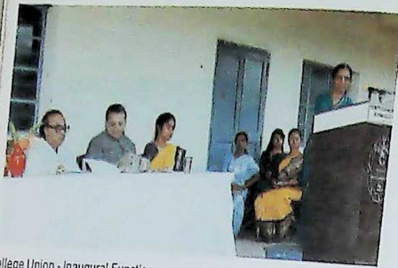
College Union - Inaugural Function