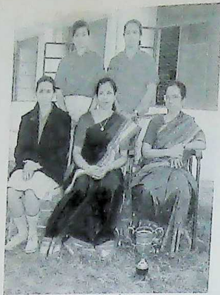
TABLE TENNIS TEAM