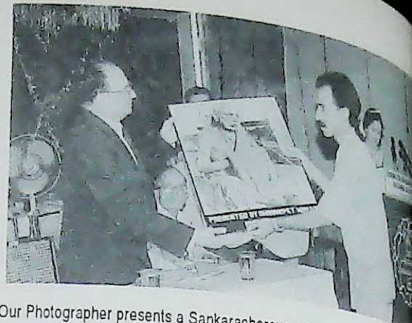
Our Photographer presents a Sankaracharayar photo to the chairman