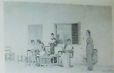
South Division Valedictory