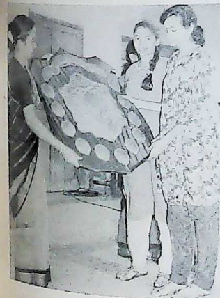
ATHLETICS WINNERS AT THE A L MUDALIAR SPORTS MEET