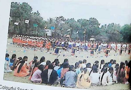
Colourful Sports Day Celebrations