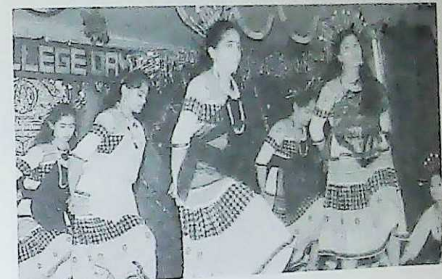
College Day - Entertainment