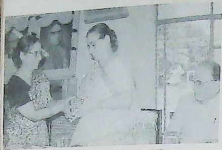
Welcoming the Founder's daughter - Founder's Day