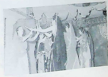
College Day - Entertainment