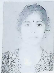
PORCHELVI III B.Com. (Evening) Student Secretary Evening College