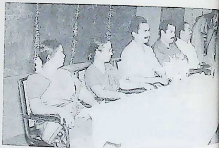
SMRITI Inter School Essay Competition - Chief Guests