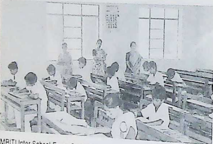
SMRITI Inter School Essay Competition