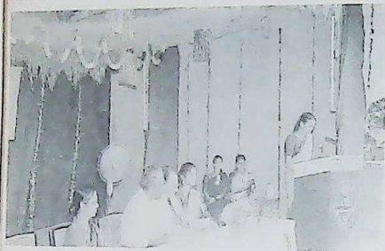
SMRITI - Inaugural