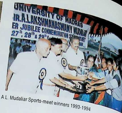
A.L. Mudaliar Sports-meet winners 1993-1994