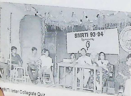
SMRITI Inter Collegiate Quiz