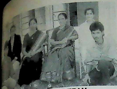
SHUTTLE BADMINTON TEAM