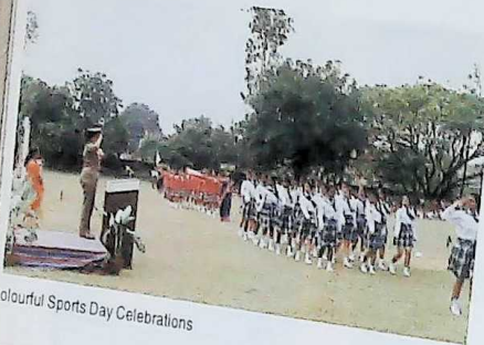
Colourful Sports Day Celebrations