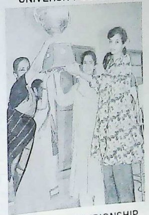
OVERALL CHAMPIONSHIP - SOUTH DIVISION MATCHES 93-94