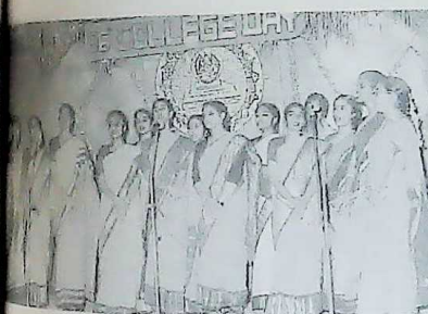
College Day - Entertainment